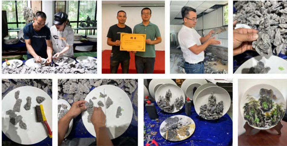
图 2 非遗进乡村：英石盆景技艺乡村美育课堂剪影

头黏接在一起。在黏接的时候需要孩子们考虑一下是竖峰的形式还是横叠形式进行黏接。竖峰形式就是顺着英石的纹理竖着叠出山峰的走势，能够很好表达出陡峭险峻的山势，但是这样叠的难度比较高；横叠形式是顺着英石的纹理横叠成山，可以创作出漂浮感，难度不大。