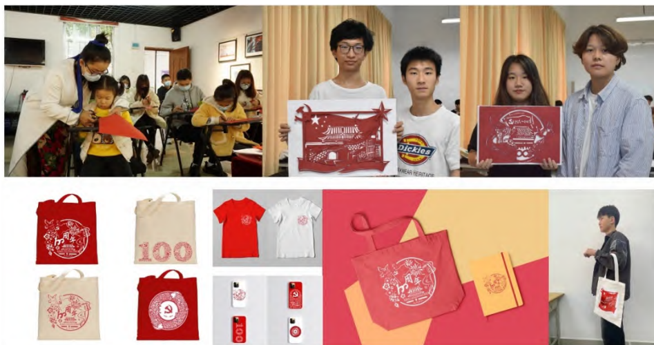
图3 非遗进乡村：剪纸技艺美育课堂剪影